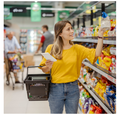
in de supermarkt