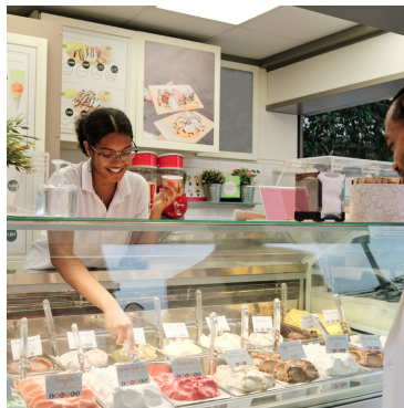
in de ijswinkel