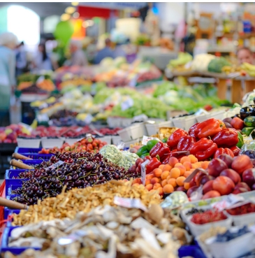
op de markt