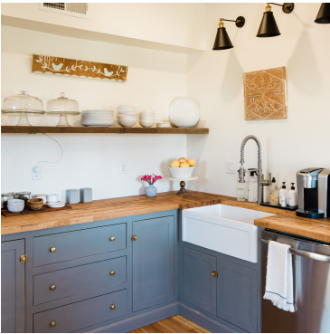
in de keuken