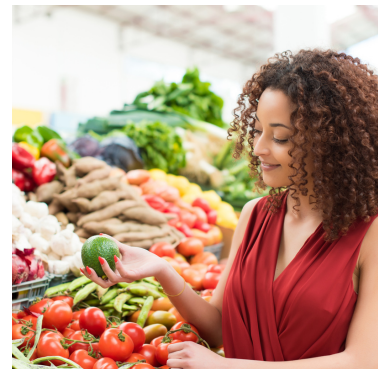
in de groentenwinkel