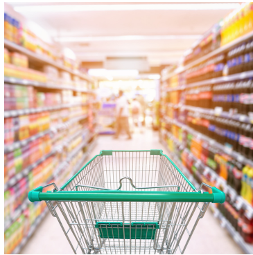
in de winkel