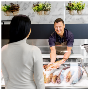
in de viswinkel