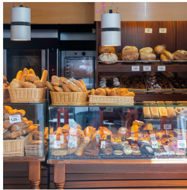
in de bakkerij