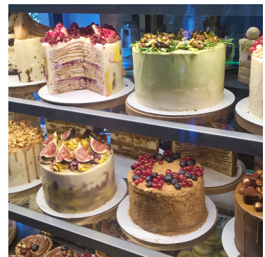
in de taartenwinkel