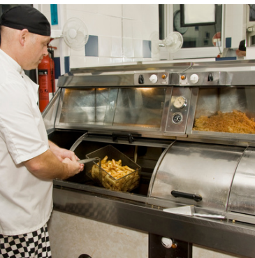
in de snackbar