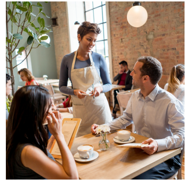
in het restaurant