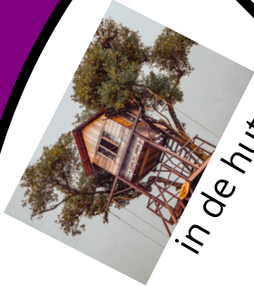
in de hut