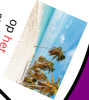
op het strand