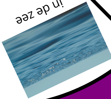
in de zee