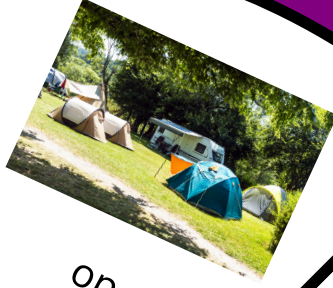
op de campiing