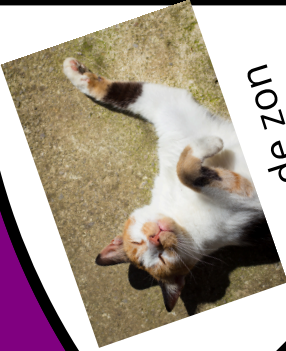
in op zo'n