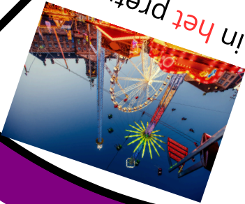
in het pretpark