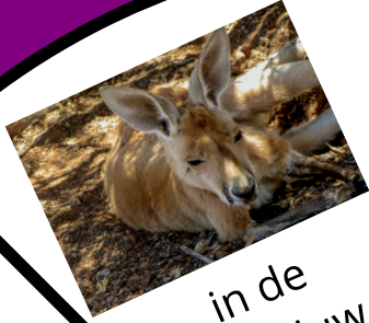
in de schaduw