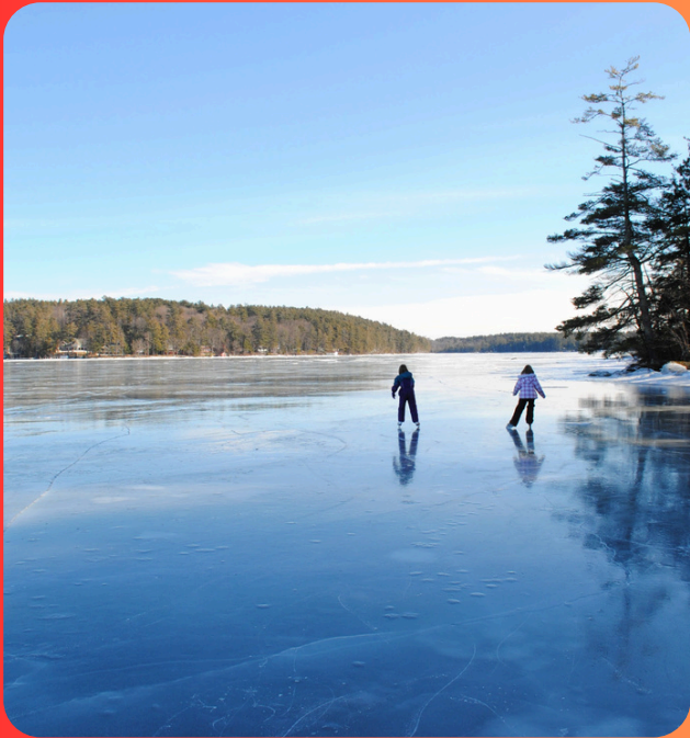
het bevroren meer