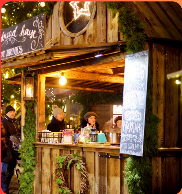
de koek en zopie