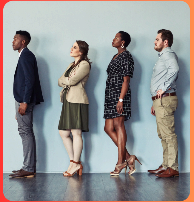
op je beurt wachten