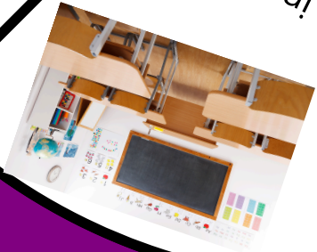
in de klas