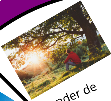
onder de boom