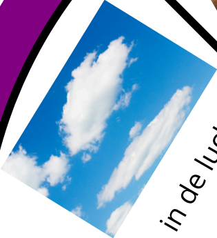
in de lucht