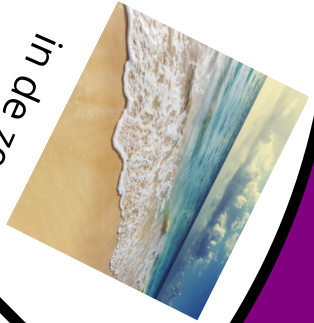
in de zee