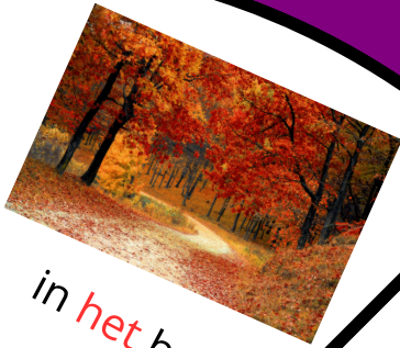
in het bos