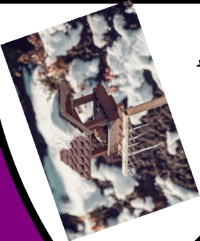
in het vogelhuisje