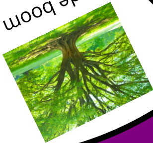
in de boom